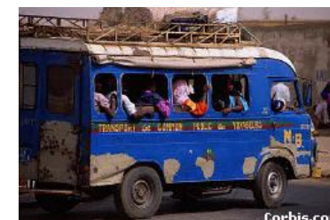
Bone haa Dakar

suklanaago kuugal bee sembe ngam haa mi wadan-e haajeji ma bana no haani." Haala seedugo bee baaba am ka fottanaay yam boodfum, ammaa mi yidaa laskingo mo bernde. Jango fajiri, bana o wi'ino, min ndilli Dakar.